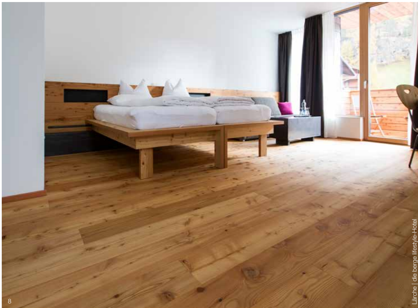
Lärche | die berge lifestyle-Hotel