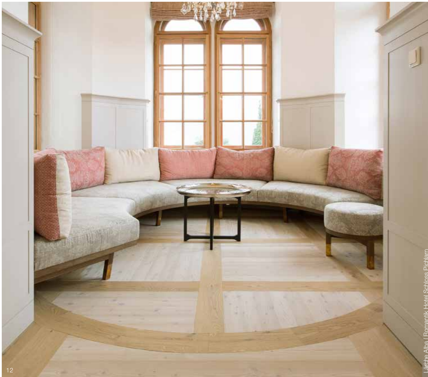
Lärche Alba | Romantik Hotel Schloss Pichlarn