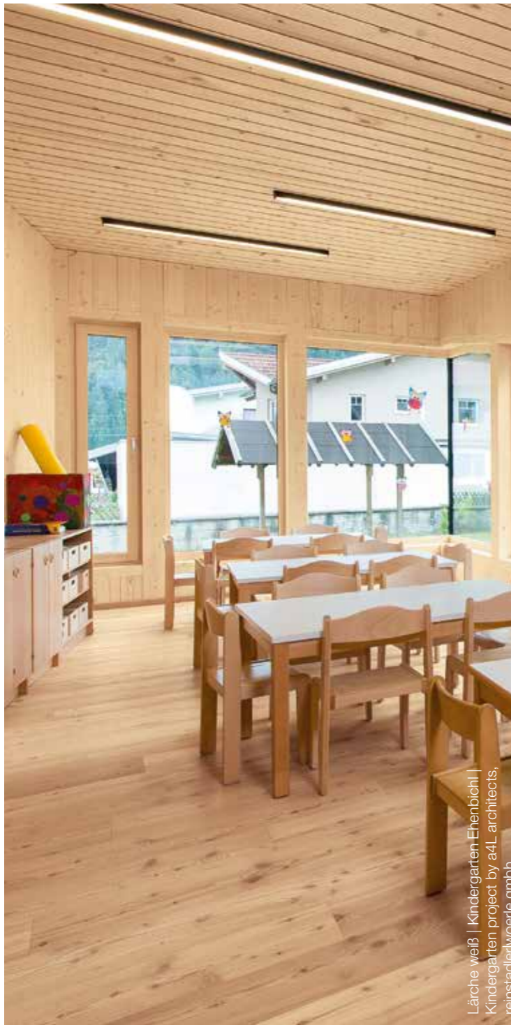
Lärche weiß | Kindergarten Ehenbichl | Kindergarten project by a4L architects, reinstadlerwoerle gmbh