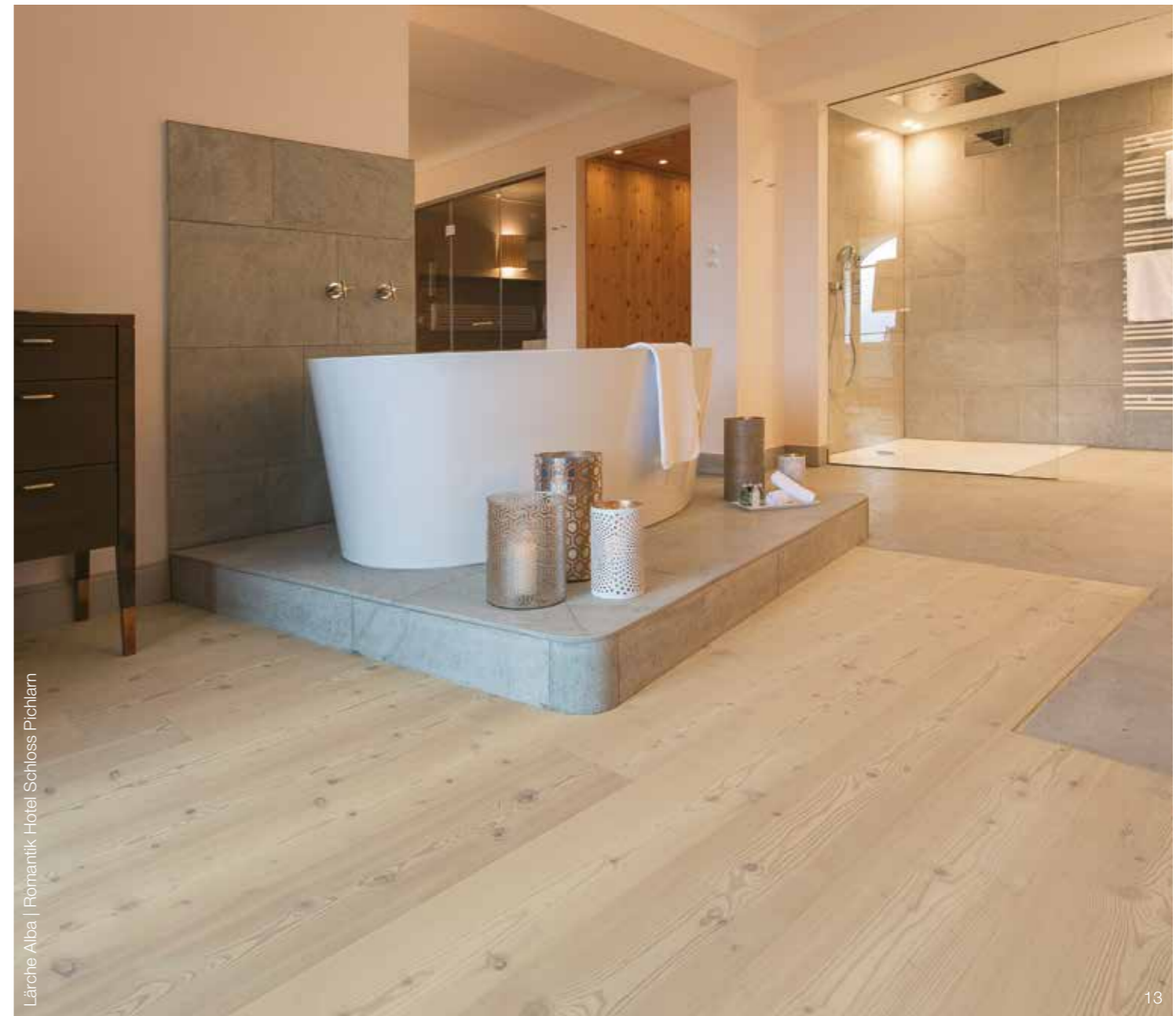
Lärche Alba | Romantik Hotel Schloss Pichlarn