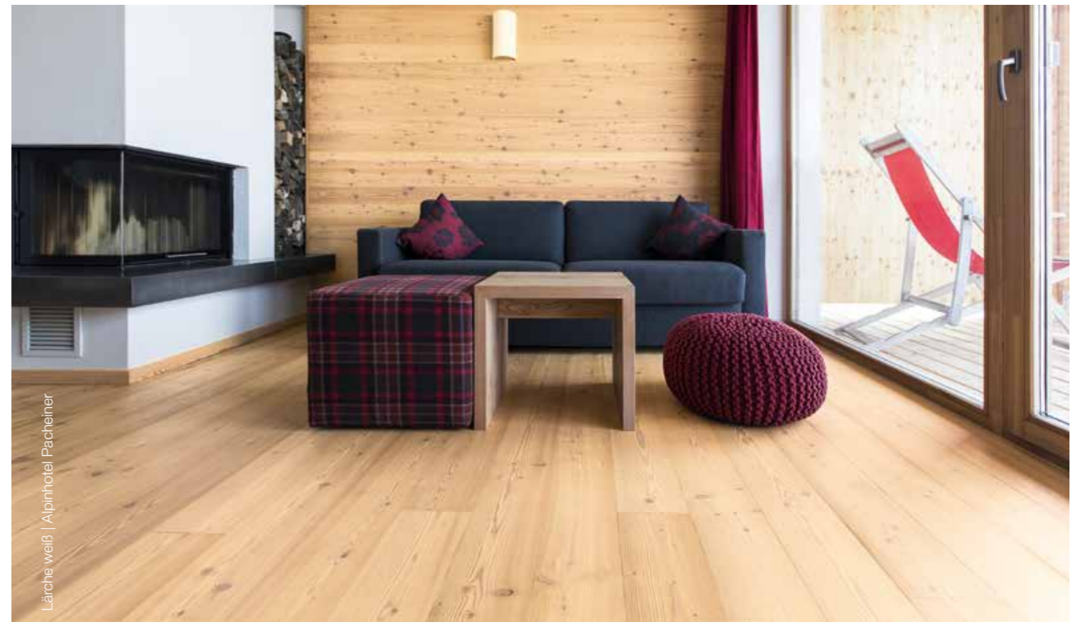
Lärche weiß | Alpinhotel Pacheiner