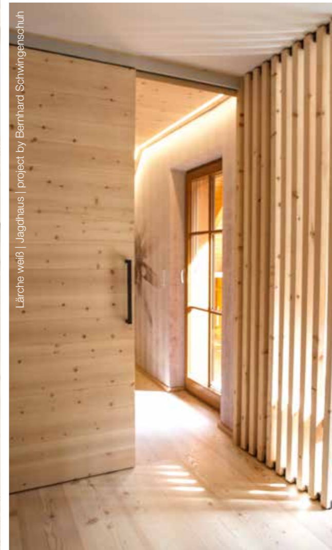
Lärche weiß | Jagdhaus | project by Bernhard Schwingsenschuh