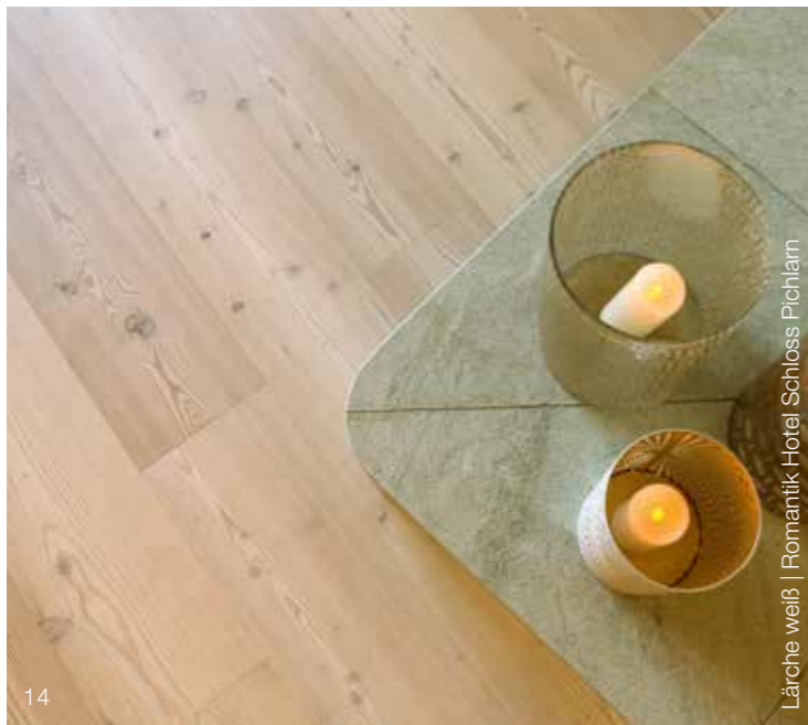
Lärche weiß | Romantik Hotel Schloss Pichlarn