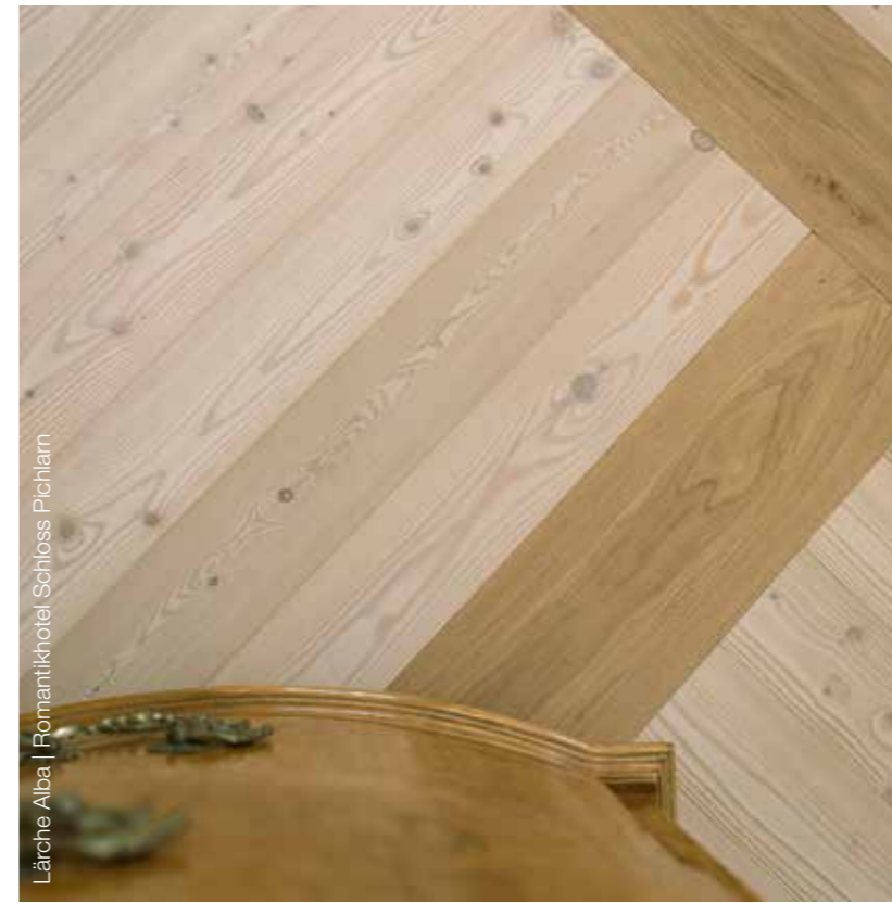
Lärche Alba | Romantikhotel Schloss Pichlarn

Elegante Klassik in Lärche: Exklusive Eleganz und doch wohlige Gemütlichkeit – das kann nur die Lärche.