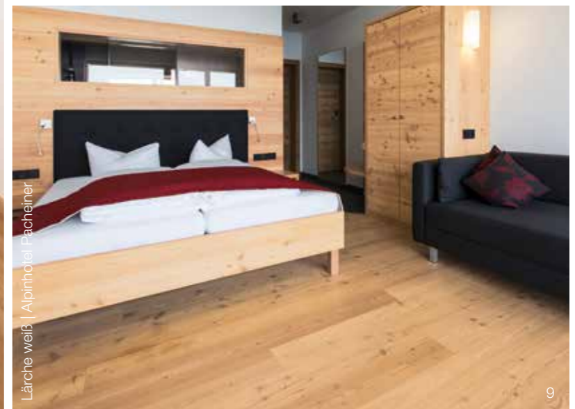
Lärche weiß | Alpinhotel Pacheiner