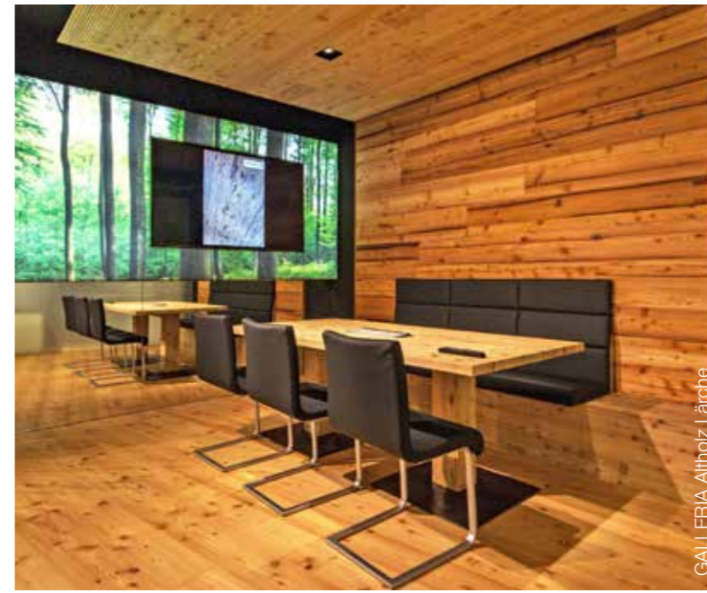
GALLERIA Altholz Lärche