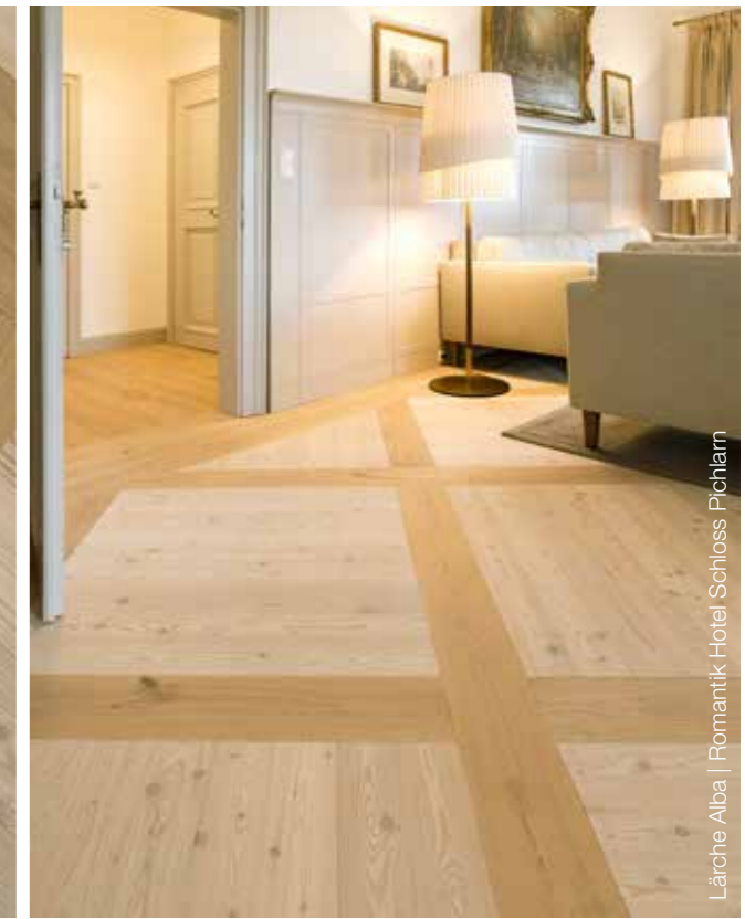
Lärche Alba | Romantik Hotel Schloss Pichlarn