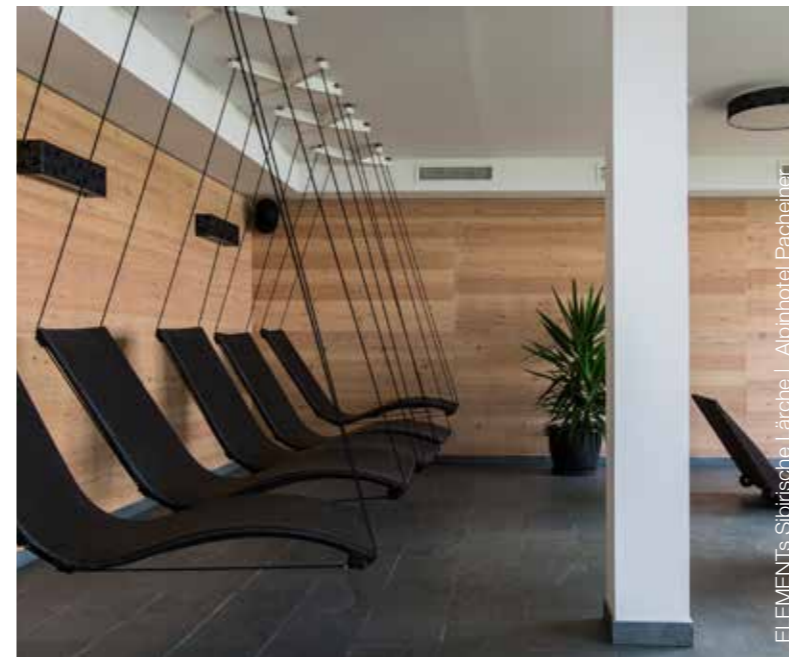
ELEMENTS Sibirsche Lärche | Alpinhotel Pacheiner