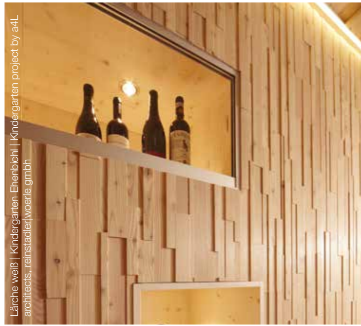
Lärche weiß | Kindergarten Ehenbichl | Kindergarten project by a4L architects, reinstadlerwoerle gmbh