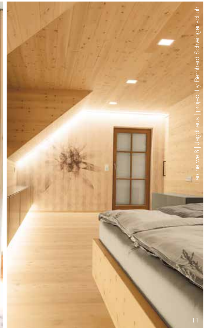
Lärche weiß | Jagdhaus | project by Bernhard Schwingsenschuh