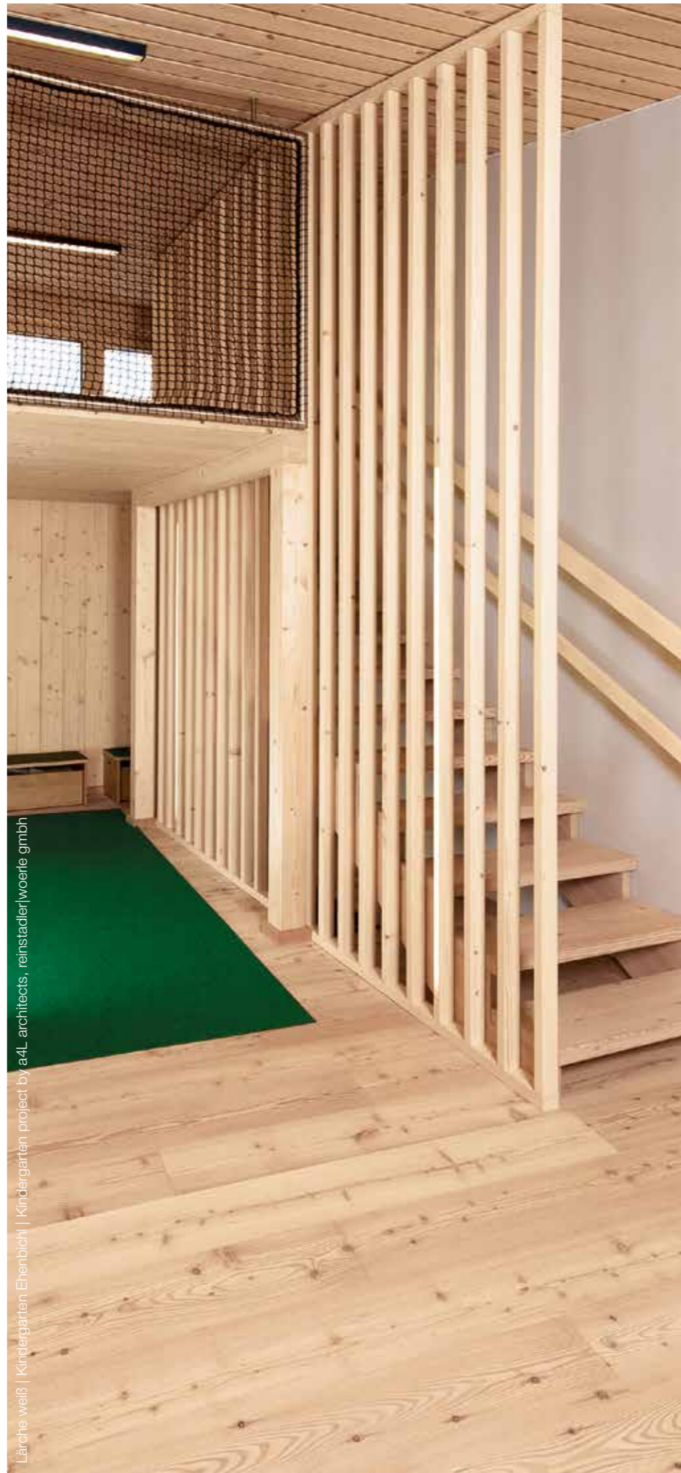
Lärche weiß | Kindergarten Ebenbich | Kindergarten project by a4L architects, reinstadlerwoerle gmbh