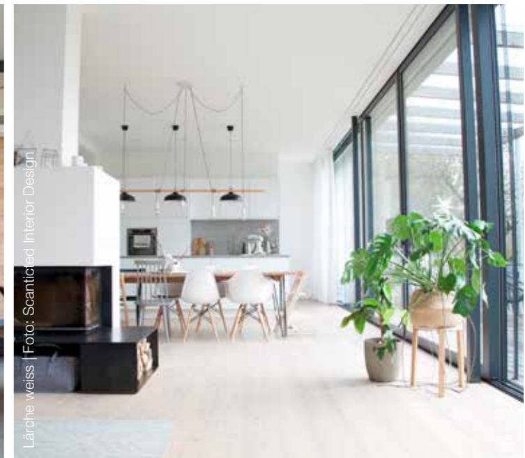
Lärche weiss