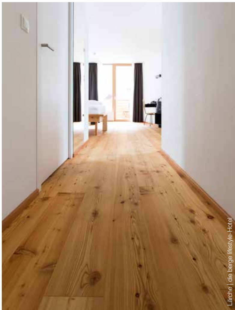
Lärche | die berge lifestyle-Hotel