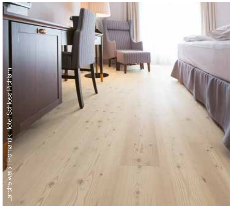
Lärche weiß | Romantik Hotel Schloss Pichlarn