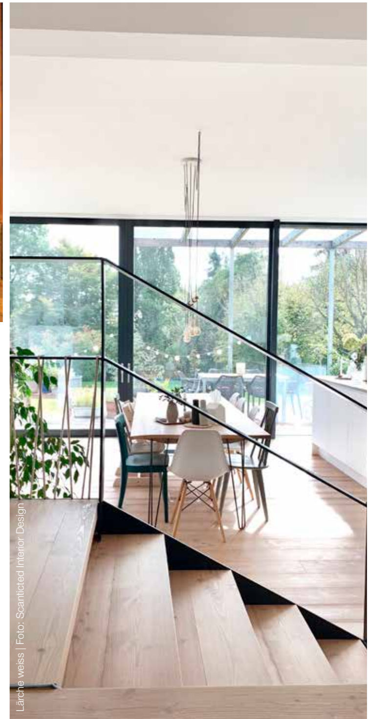
Lärche weiss

LÄRCH E INMAL ANDERS So widerstandsfähig die Lärche als Baum ist, so wandlungsfähig ist auch ihr Holz.