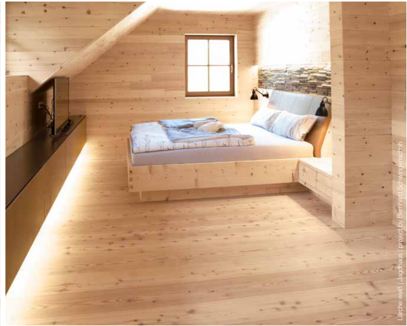
Lärche weiß | Jagdhaus | project by Bernhard Schwingsenschuh