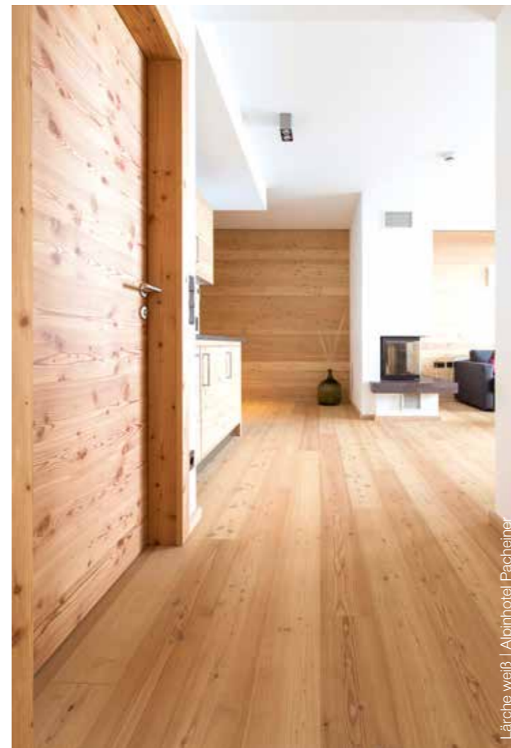
Lärche weiß | Alpinhotel Pacheiner