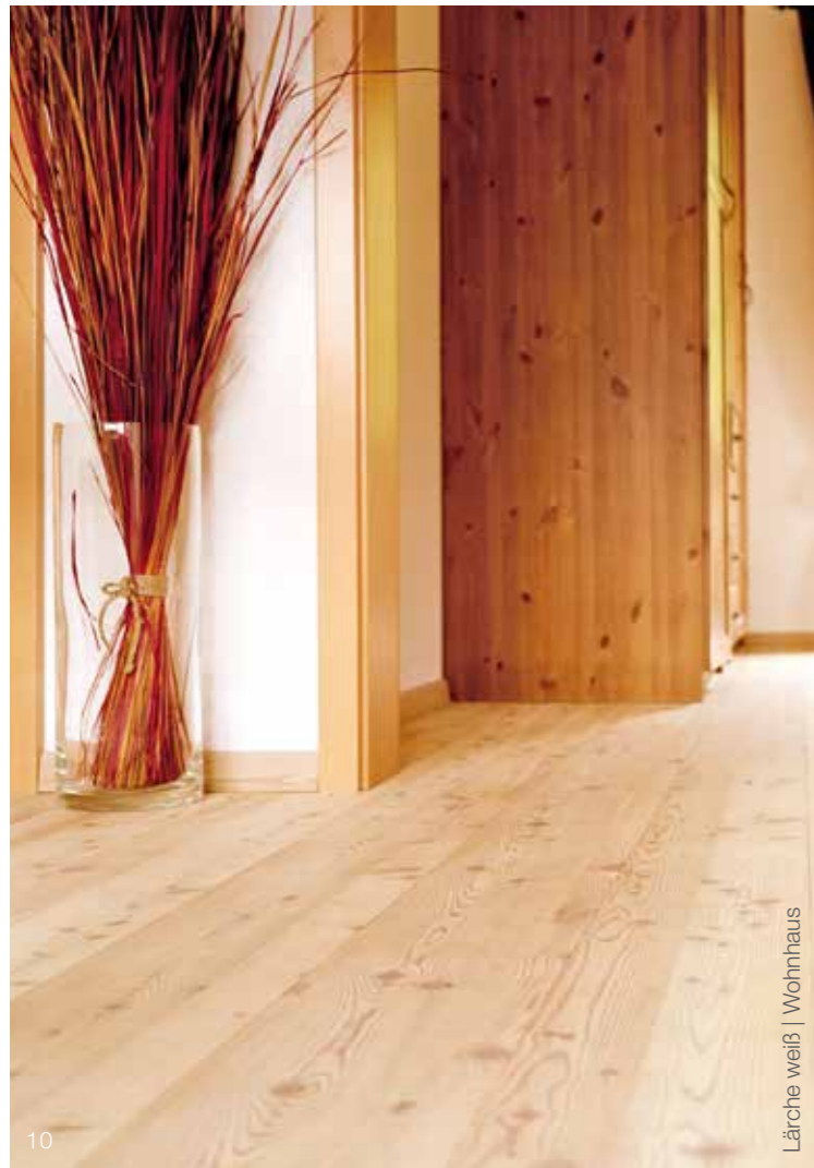
Lärche weiß | Wohnhaus